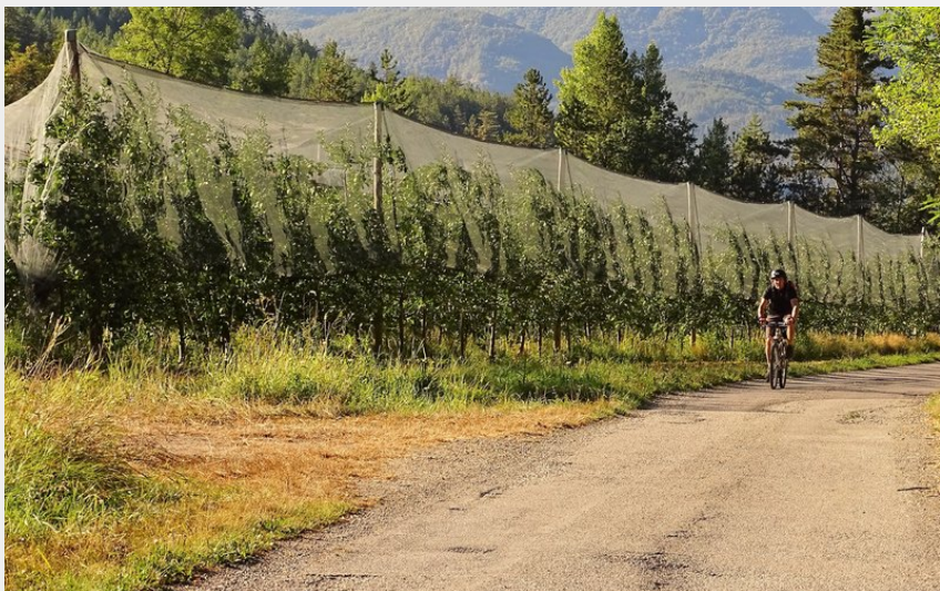
Pédalage en douceur à travers les vergers (Office de Tourisme La Motte du Caire)