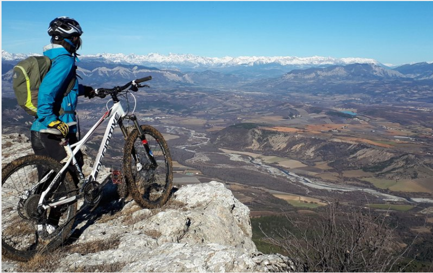
Panorama depuis la montagne de St-Cyr