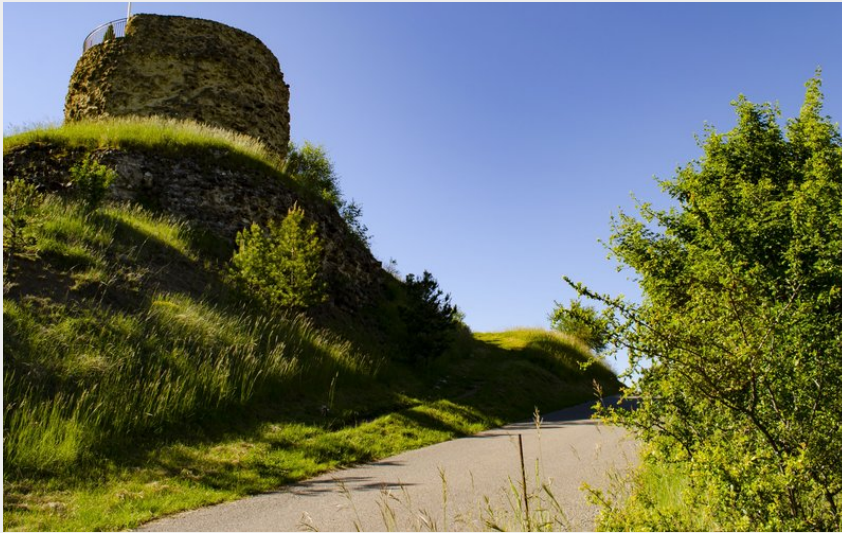
Montée à la tour (CCSB)