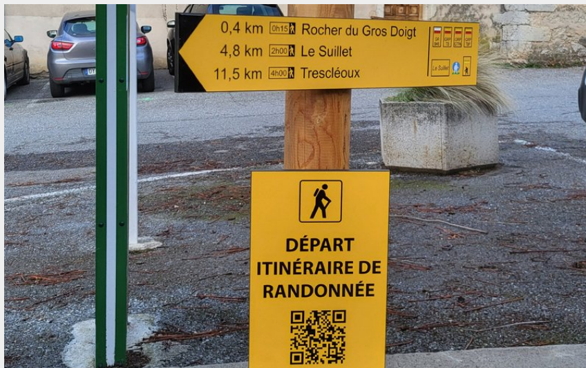
Centre d'Orpierre (CCSB)