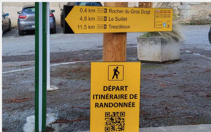
Centre d'Orpierre (CCSB)