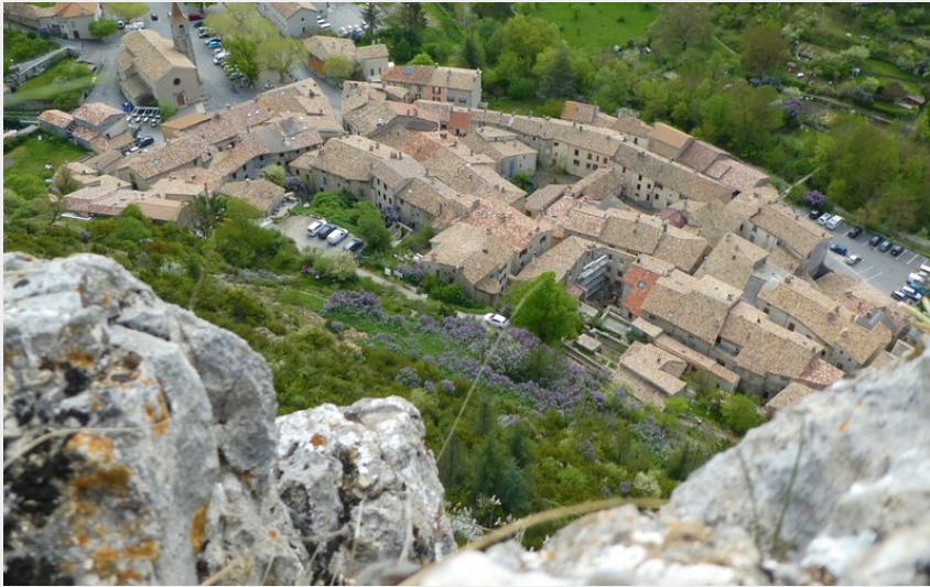
Vue plongeante sur le village d'Orpierre