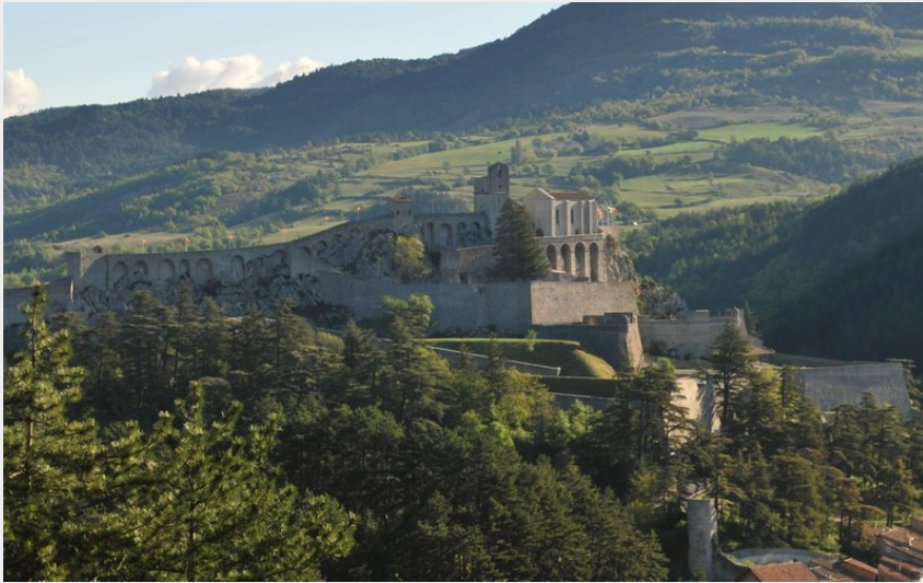
Citadelle Sisteron (CCSB)