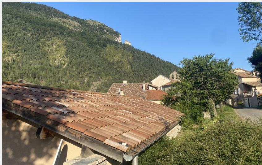
Traversée village Authon (CCSB)