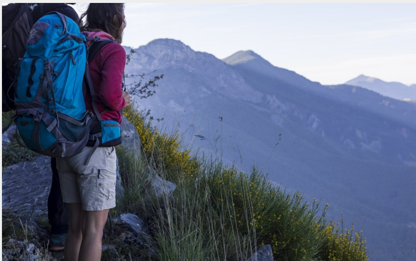
Sur les hauteurs du village de Saint-Geniez (Martin Champon)