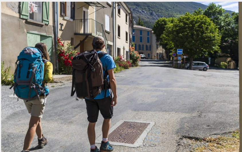
Village Saint-Geniez (Martin Champon)