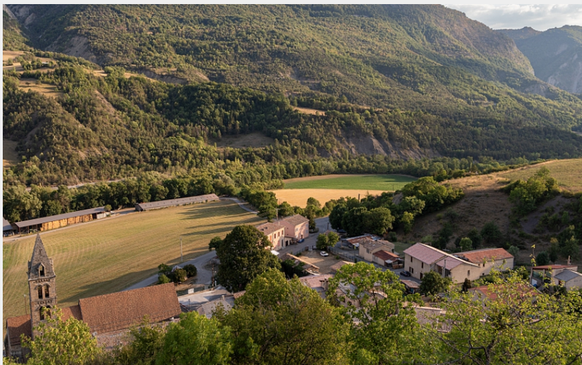
Village de Bayons (Martin Champon)