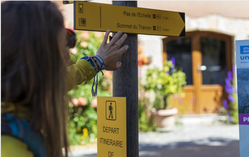
Village Saint-Geniez (Martin Champon)