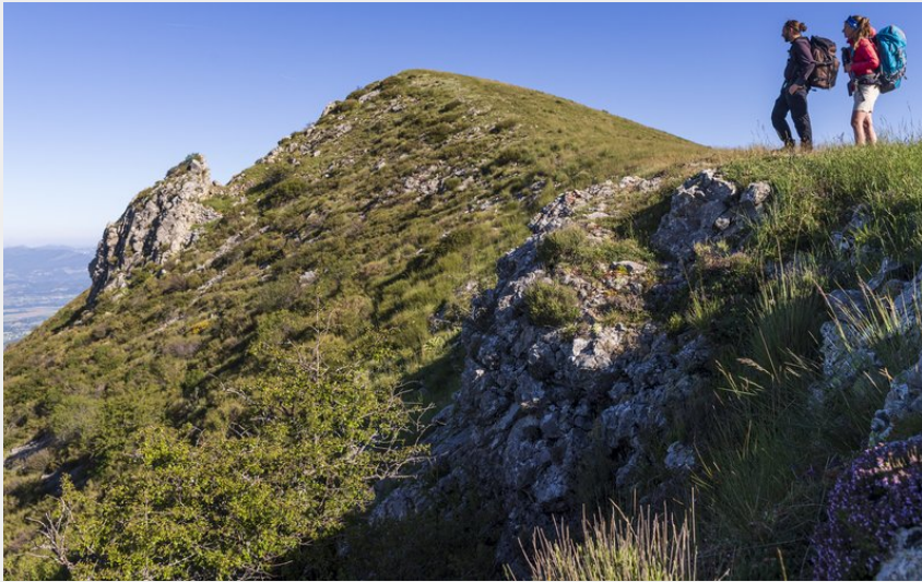
Sommet du Trainon (Martin Champon)