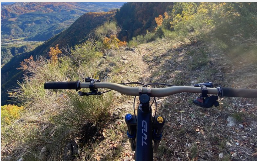
Sentier en balcon (CCSB)