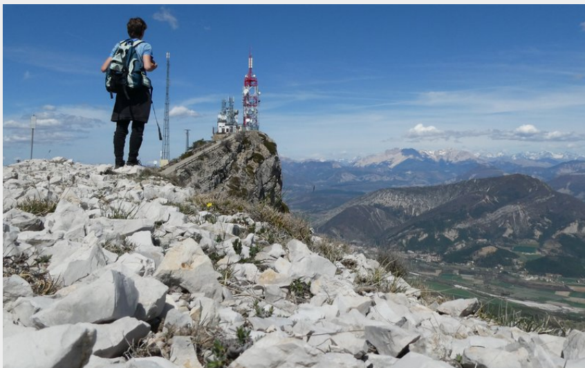
Le Rocher de Beaumont (CCSB)