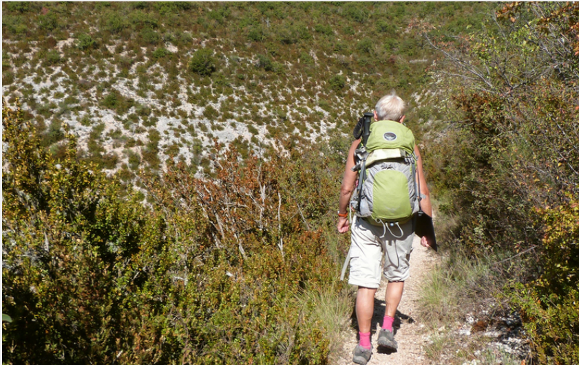
Entre Méouge et Orpierre (CDRP05)