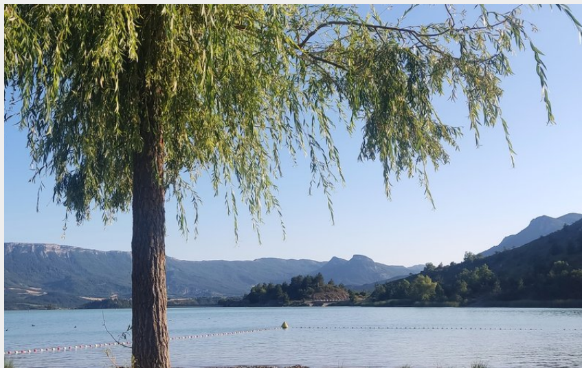
Plan d'eau du Riou (CCSB)