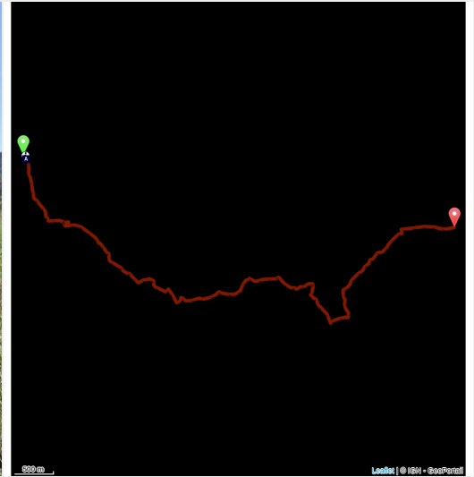
Autour de Savournon (CCSB)

Cette escapade débute dans la jolie ville de Serres, au cœur du Parc naturel régional des Baronnies provençales. Cette cité médiévale possède encore de nombreux édifices du passé que l'on peut voir en se promenant dans ses ruelles.