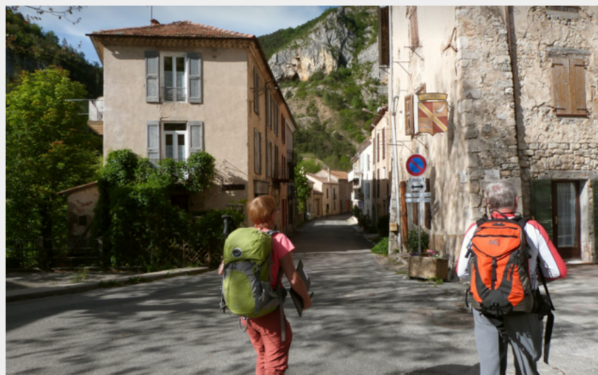
Village d'Orpierre (CDRP05)