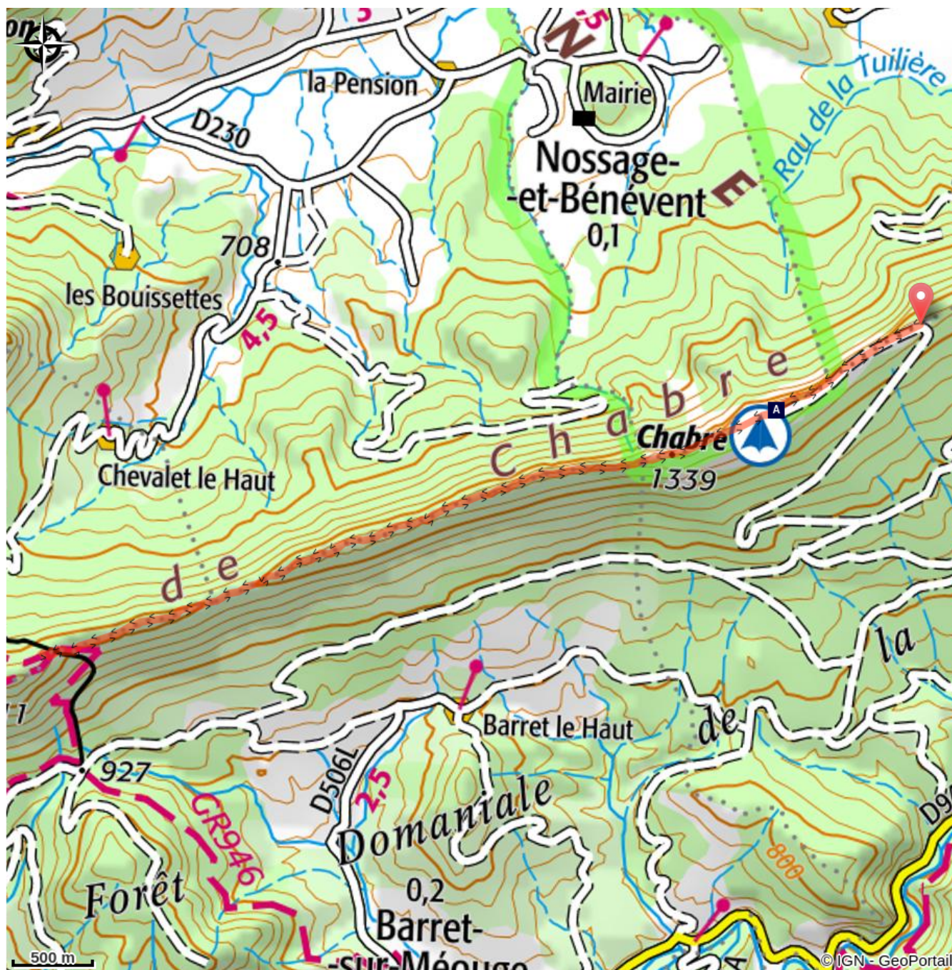
📍 Montagne de Chabre (A)