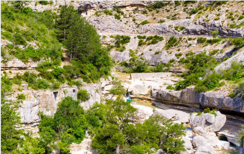
La Méouge (Remi Fabregue)