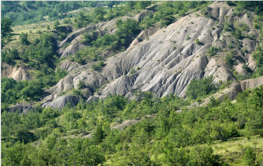
Les marnes entourant Ribiers (CDRP 05)