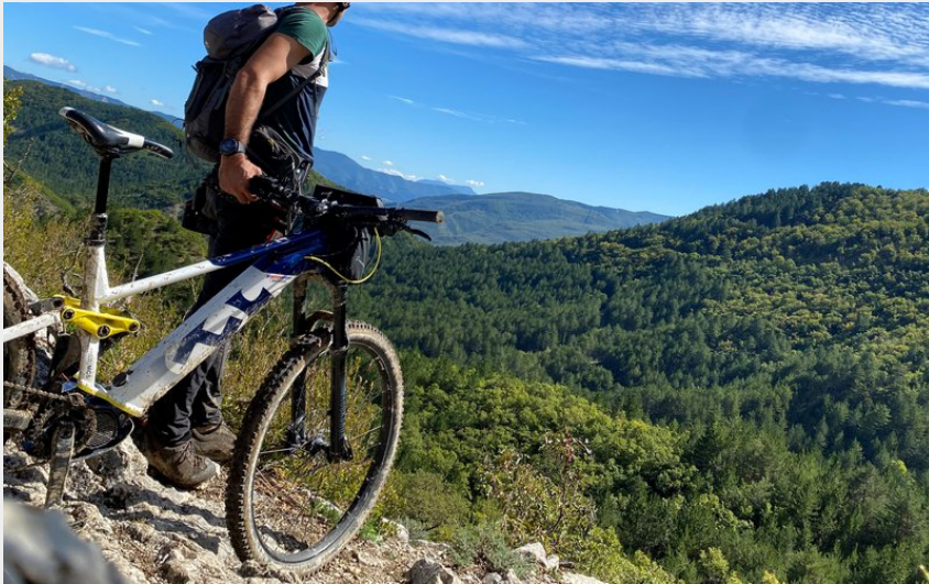
Paysages du Sisteronais (CCSB)