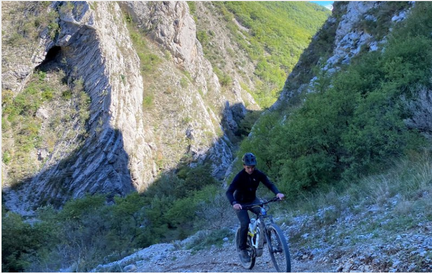
Portion sur sentier (CCSB)