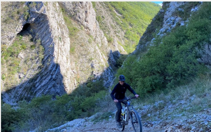
Portion sur sentier (CCSB)