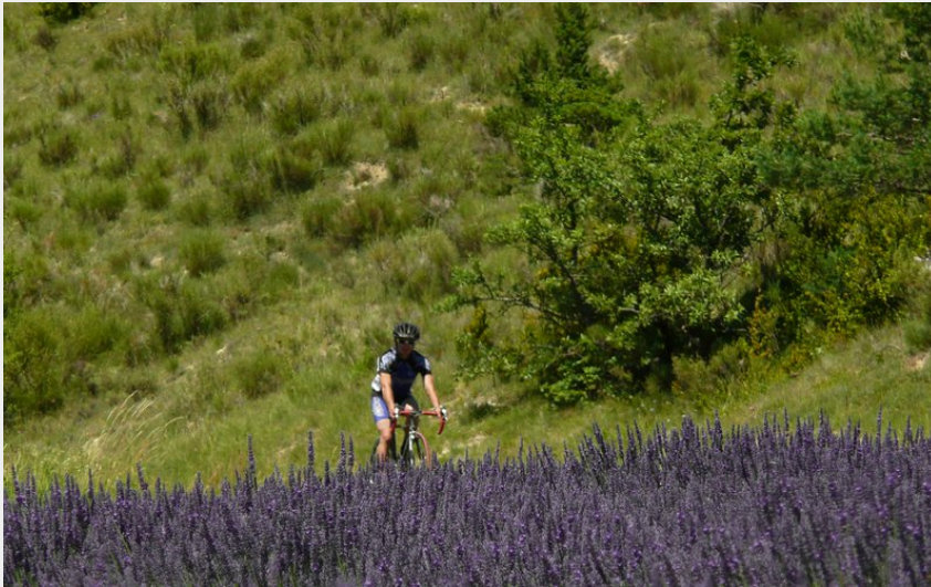
Passage dans les lavandes (CCSB)