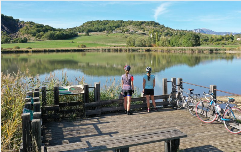
Le lac de Mison (CCSB)