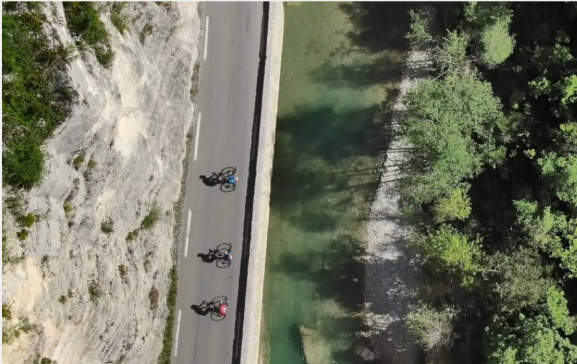
Gorges de la Méouge (CCSB)