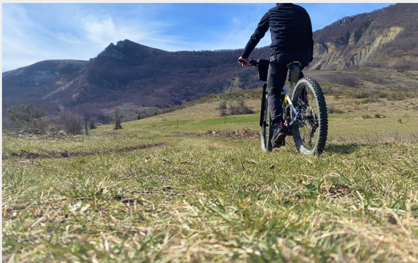
Paysage dégagé autour d'Éourres (CCSB)