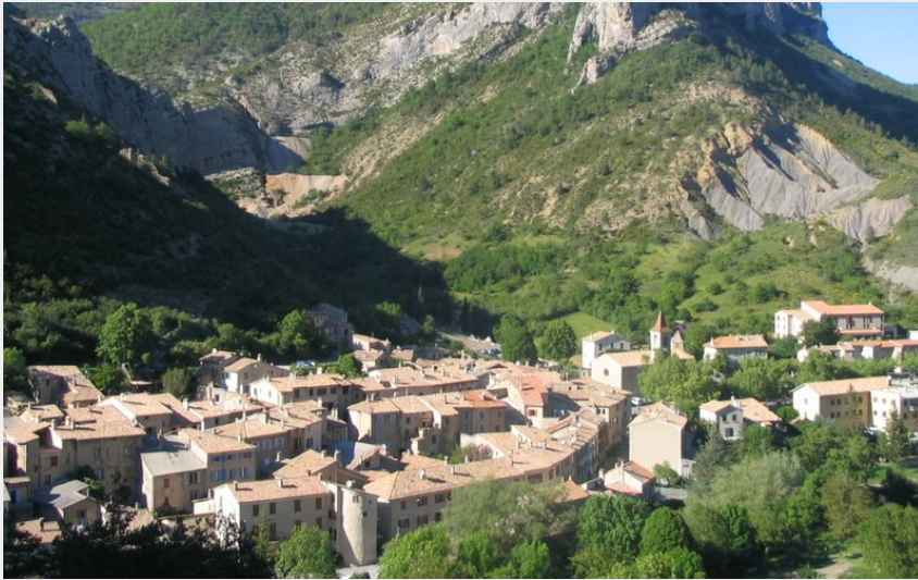
Village d'Orpierre (CCSB)