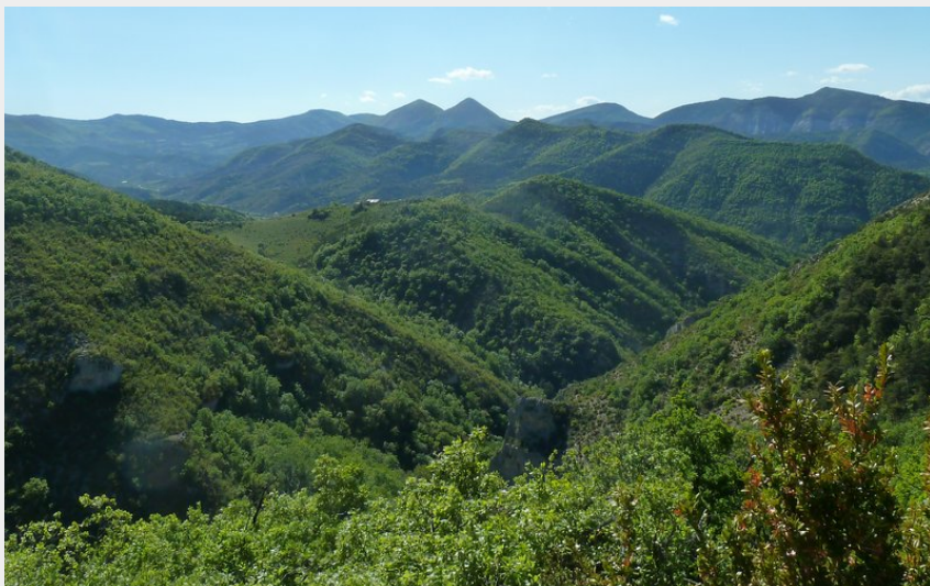
Panorama depuis le Rocher Saint-Michel (CCSB)