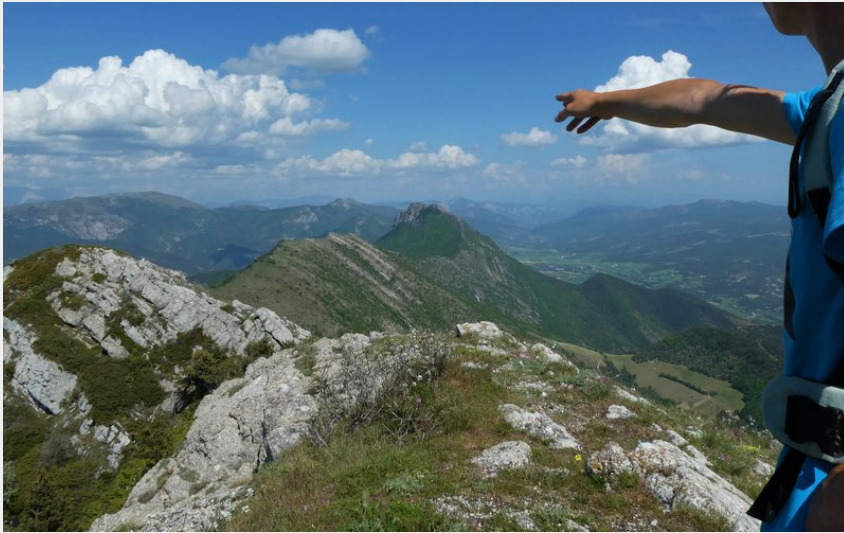
Sommet du Fourchat (CCSB)