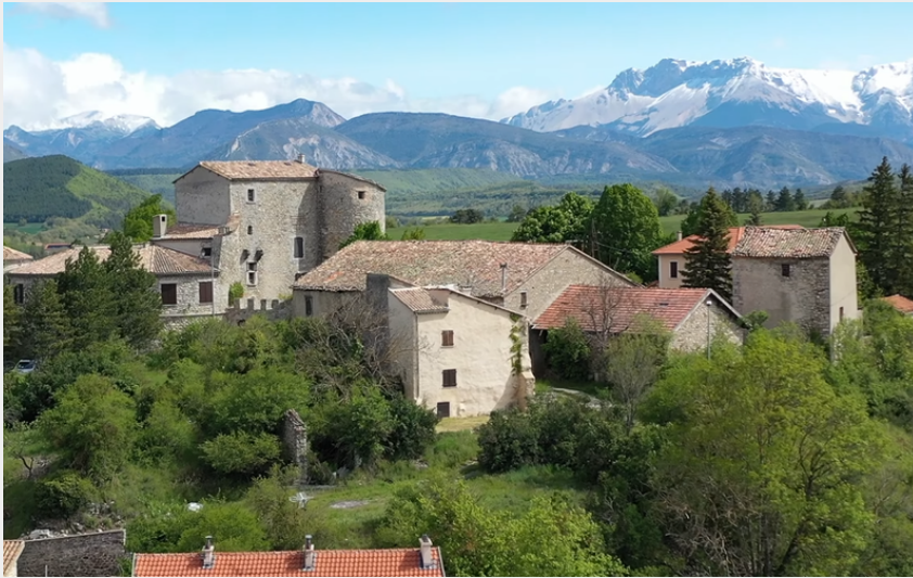
La Bâtie-Montsaléon (CCSB)