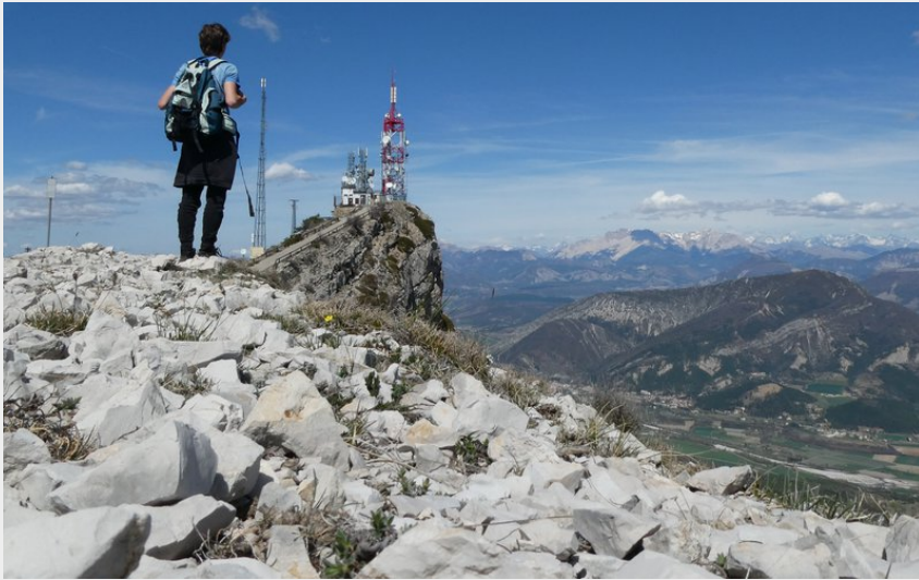
Sommet du Rocher de Beaumont (CCSB)