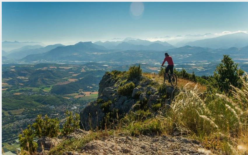
Depuis les hauteurs de la Montagne de Chabre (CCSB)