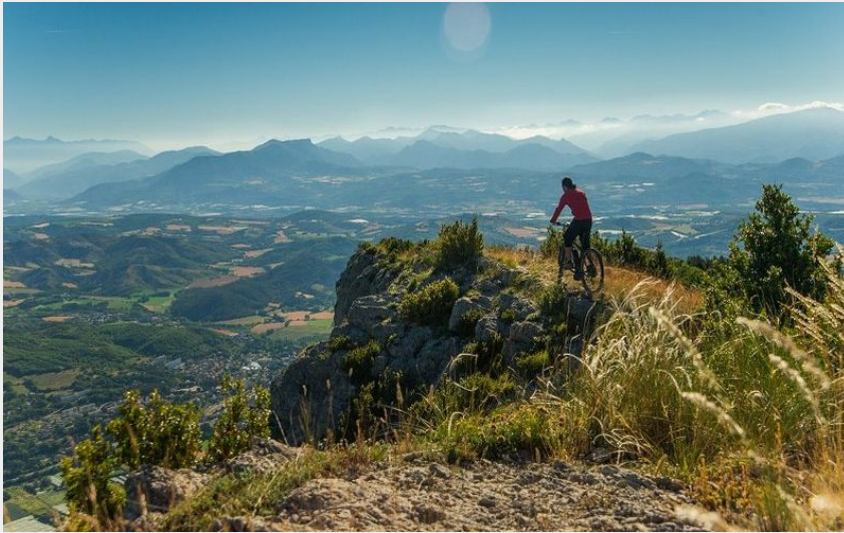
Depuis les hauteurs de la Montagne de Chabre (CCSB)