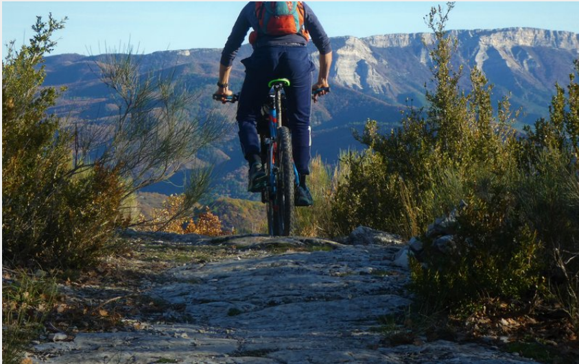
Paysages sauvages autour de la montagne de l'Ubac (CCSB)