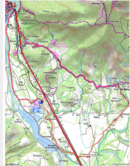
Le long du Buëch (CCSB)

Un circuit ludique et varié qui plaira aux adolescents, durant lequel il peut être envisagé une pause détente à la base de loisirs de la Germanette.