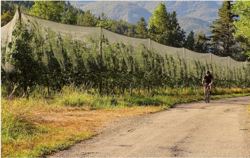
Pédalage en douceur à travers les vergers (Office de Tourisme La Motte du Caire)