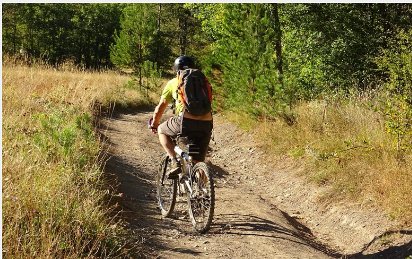
Un itinéraire principalement sur pistes