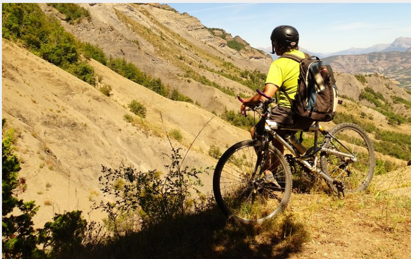
De beaux paysages de moyenne montagne