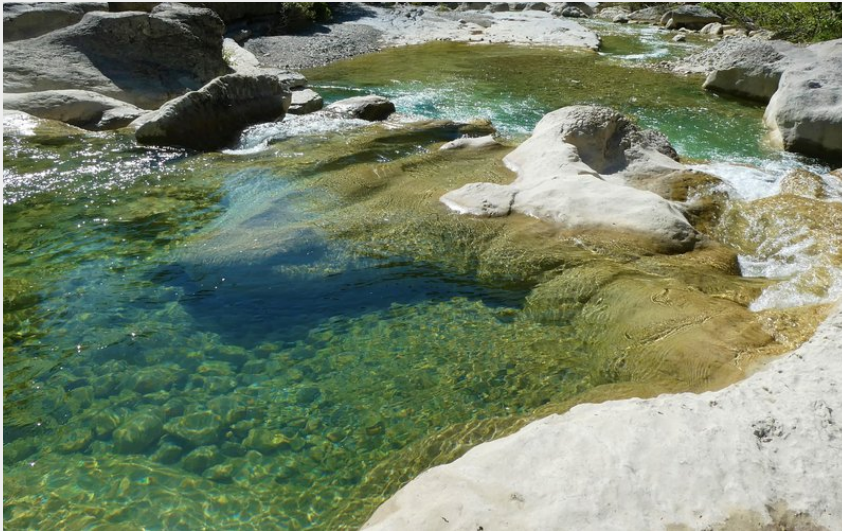
Belles piscines naturelles (CCSB)