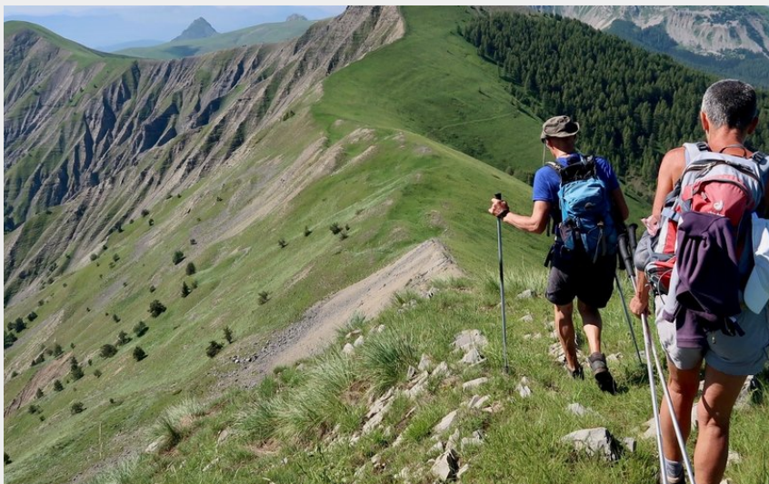
Vue époustouflante depuis la crête (Office de Tourisme La Motte du Caire)