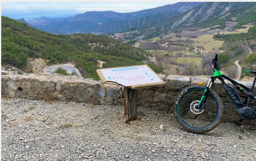
Panneau explicatif sur la Vallée de l'Oule (CCSB)