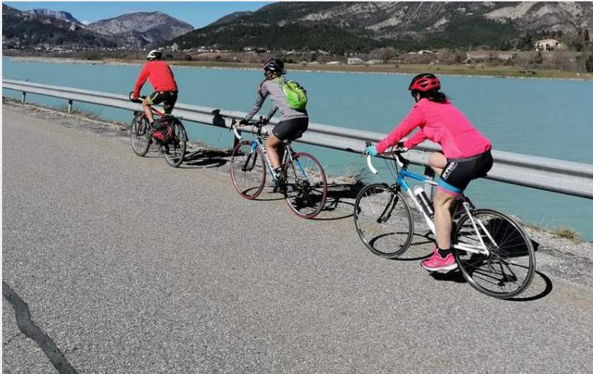
Le long du Buëch (CCSB)