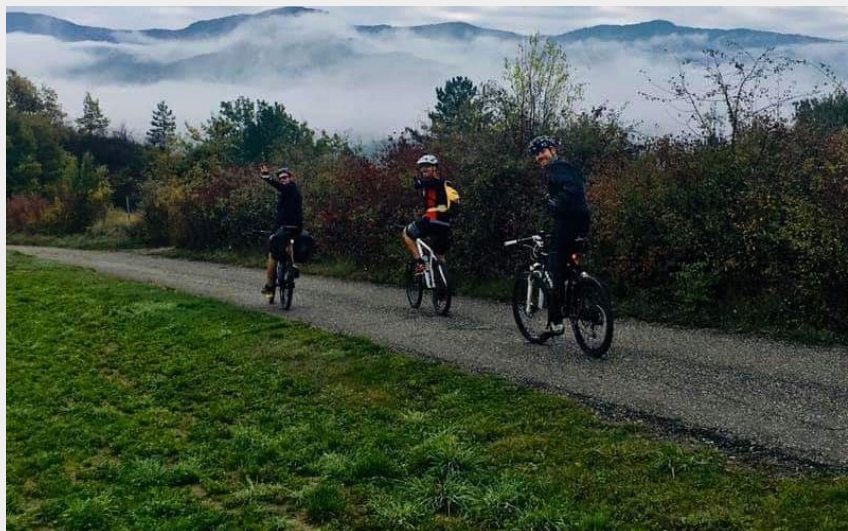
Autour de Curbans (CCSB)