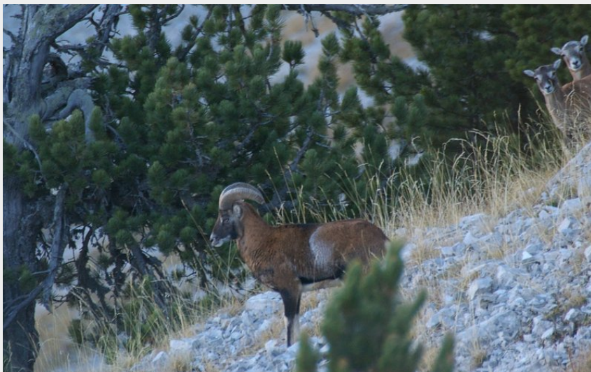
Observation des mouflons dans le massif des Monges