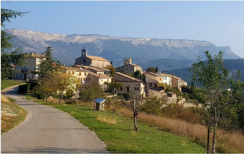
Village de Laragne