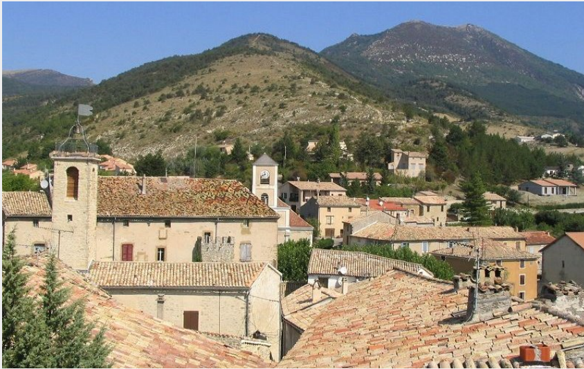
Rosans depuis les hauteurs (CCSB)