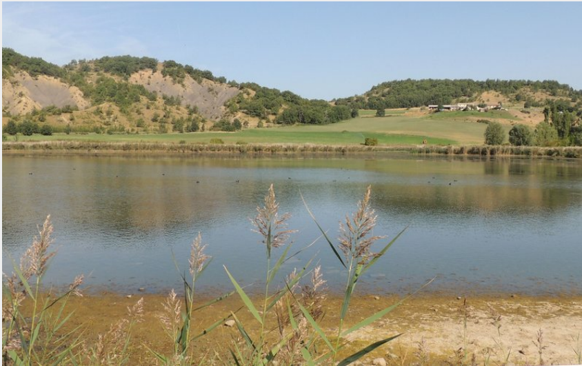
Au bord du lac de Mison