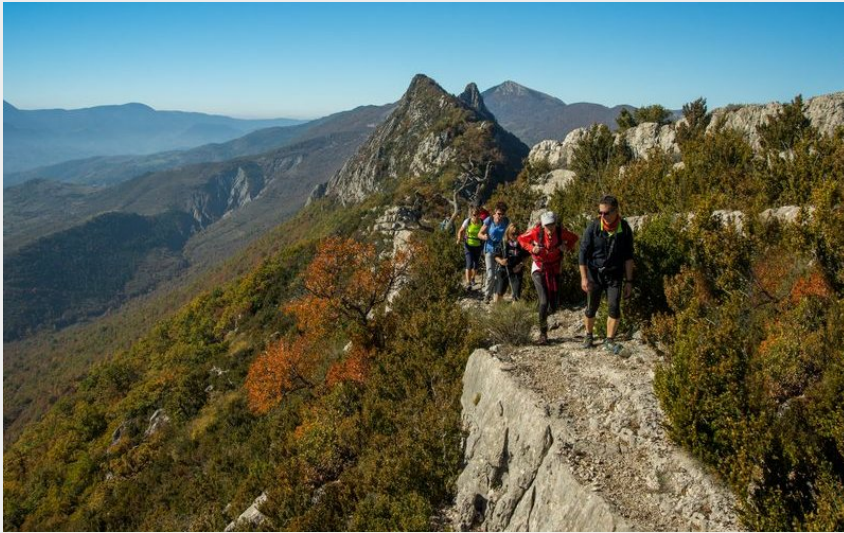
En route sur la crête ! (Espace Rando)